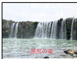
編集加工した写真